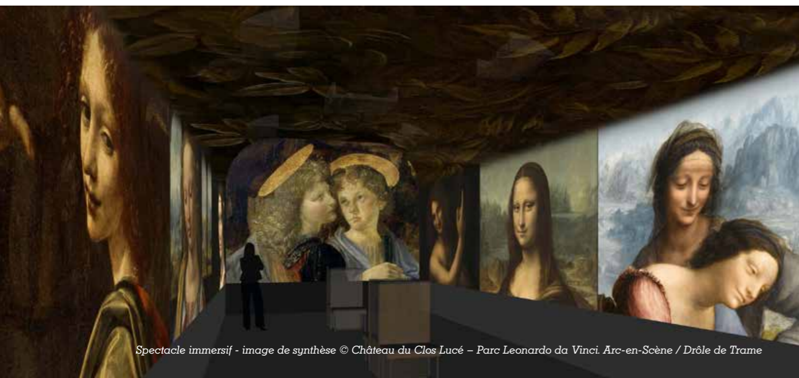
Spectacle immersif - image de synthèse

La réunion en une seule galerie des trésors du Louvre, de la Galerie des Offices de Florence, des musées du Vatican, de la National Gallery de Londres, de la Pinacothèque de Munich, du Musée National de Cracovie, de l'Ermitage de Saint-Petersbourg, de la National Gallery de Washington, constitue une nouvelle approche et une plongée inédite dans l'œuvre peinte de Léonard de Vinci. Placé au centre du dispositif de projection, le visiteur est invité à un voyage immersif pour contempler le legs pictural et esthétique de l'artiste. Les correspondances des visages, des sourires et des mains, la perspective, le sfumato, la Cène et les horizons bleutés des paysages de ses tableaux se mêlent dans une ronde poétique et fascinante.