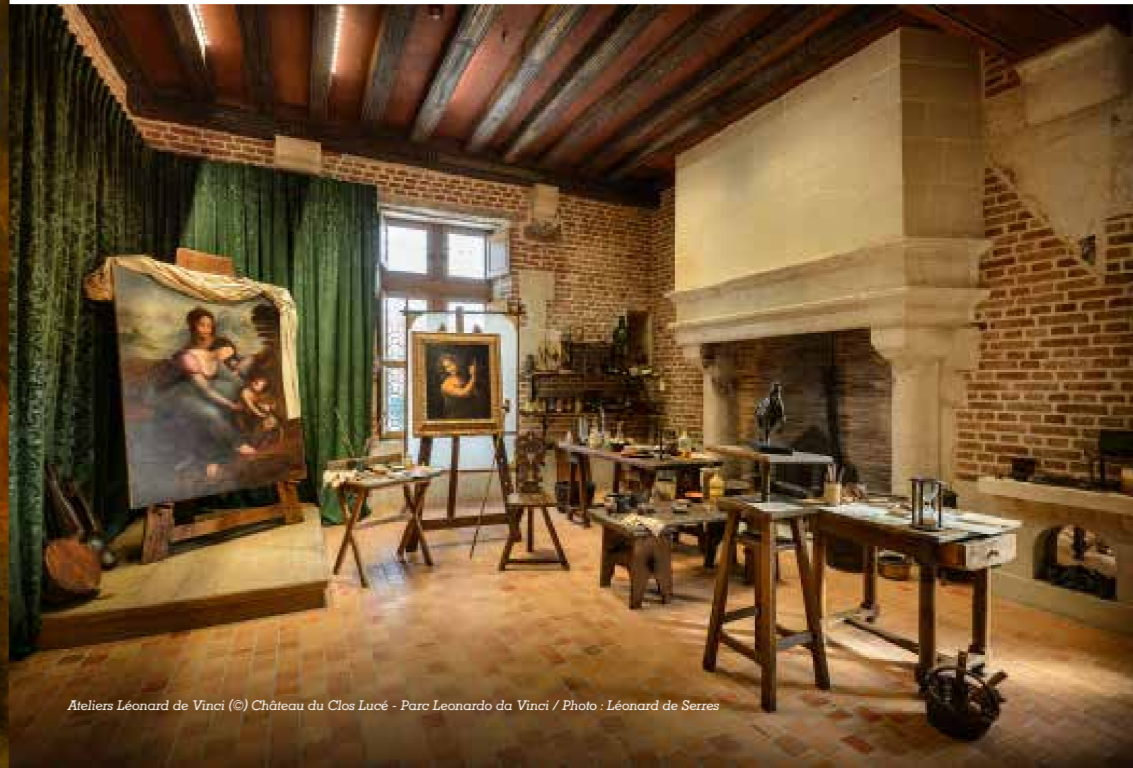
Ateliers Léonard de Vinci

Dans le Parc culturel Leonardo da Vinci de 7 hectares, des machines des fabuleuses inventions de Léonard de Vinci, des toiles géantes translucides et des bornes sonores complètent la découverte du lieu.