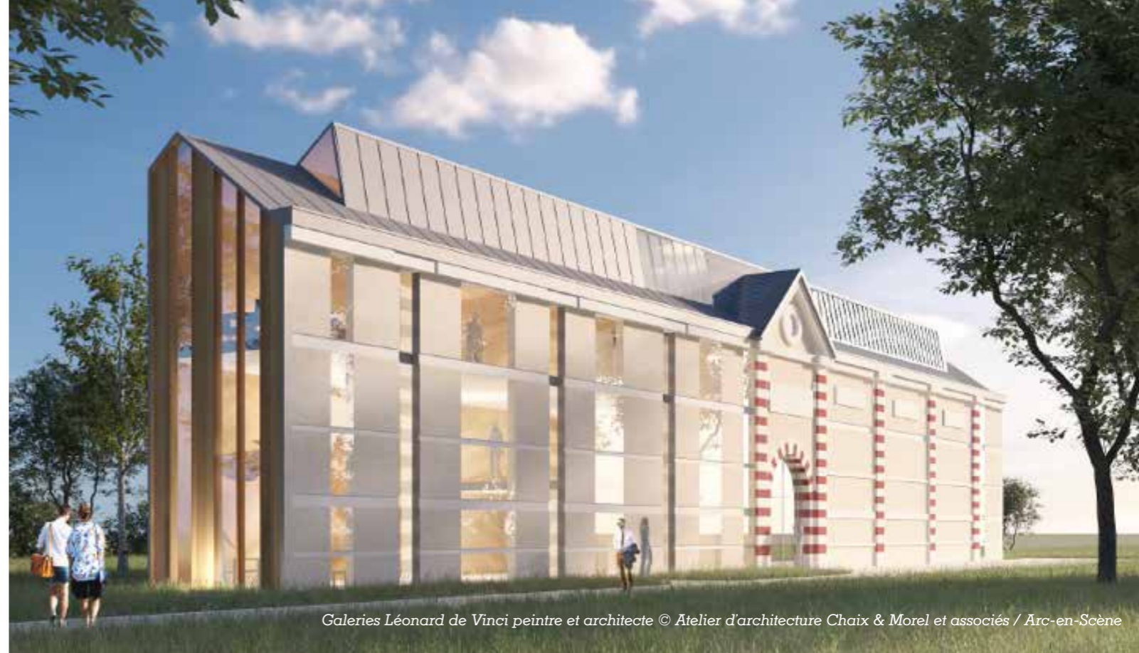
Galleries Léonard de Vinci peintre et architecte © Atelier d'architecture Chaix & Morel et associés / Arc-en-Scène