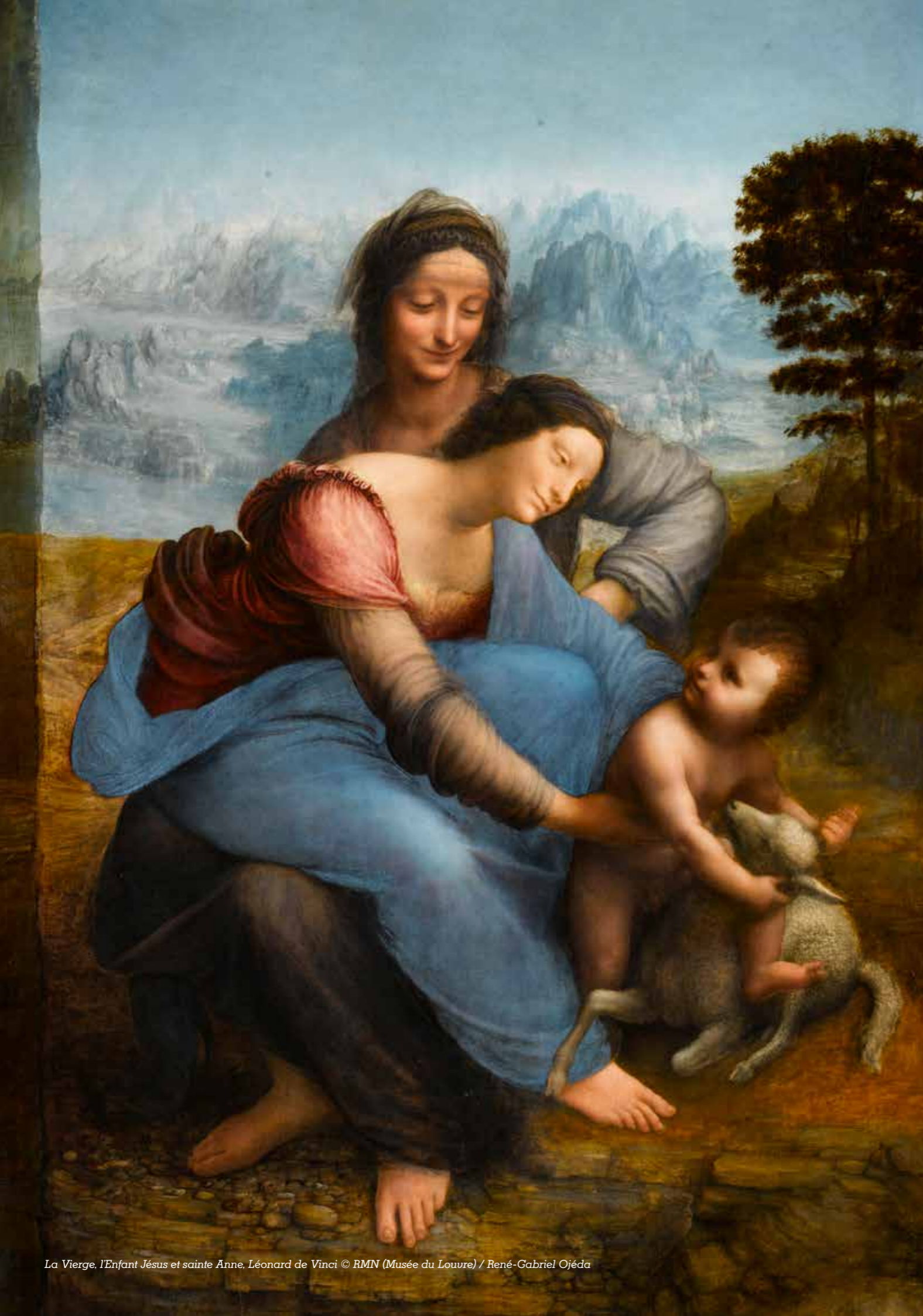
La Vierge, l'Enfant Jésus et sainte Anne, Léonard de Vinci